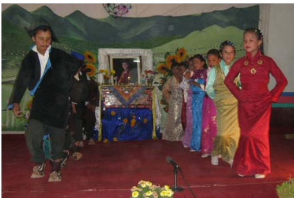
Photo de gauche Les étudiants distrayant les invités lors de la "journée des parents" en septembre