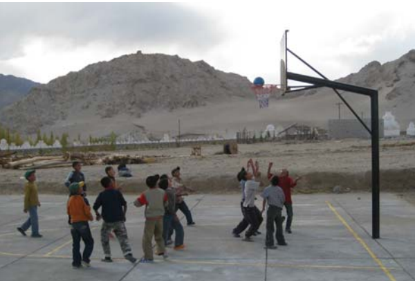
Photo de droite Le nouveau terrain de basket fait bon usage