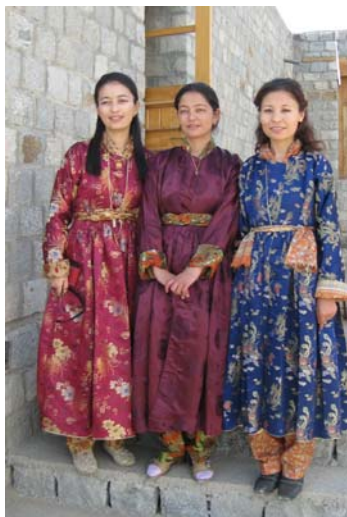
Photo de gauche Professeurs lors de la "journée des parents", septembre