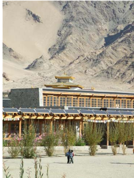
Photo de gauche Le projet d'Arup Associates pour la construction d'une nouvelle bibliothèque au-dessus de la cour centrale, avec des panneaux solaires sur le toit. La collecte des fonds est en cours.