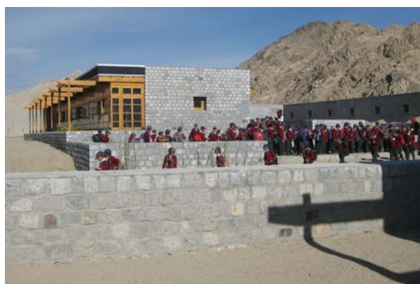
Photo de droite La Résidence 3 Sud a été accompli et est maintenant occupée