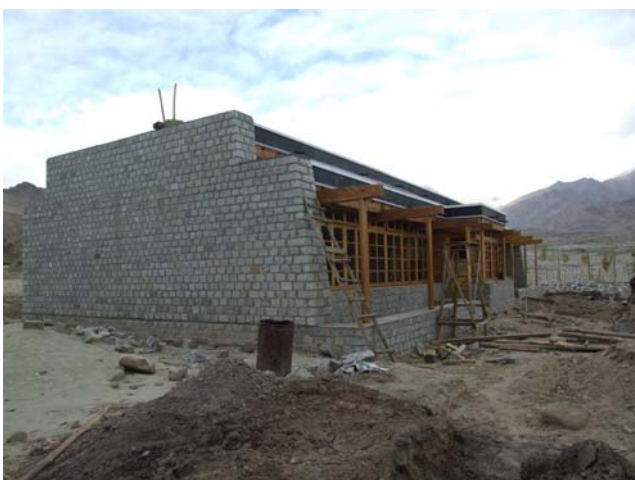
Ci-dessous La construction de la Résidence 3 Nord a débutée et la Résidence réalisée doit s'ouvrir au début de 2009